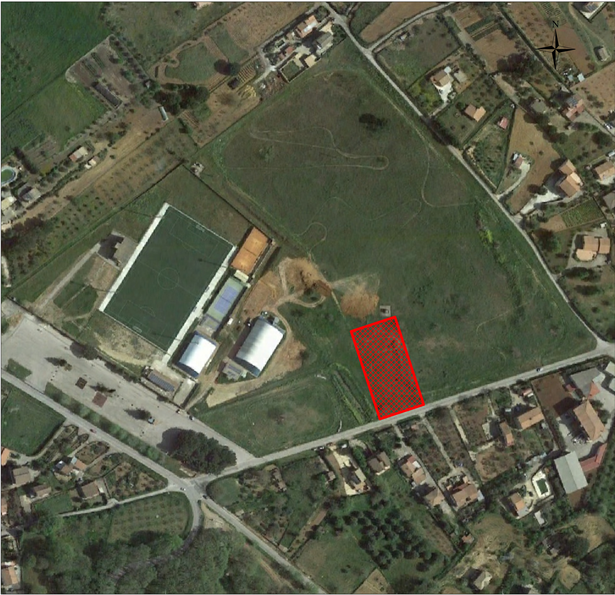
ORTOFOTO (scala 1:2000)