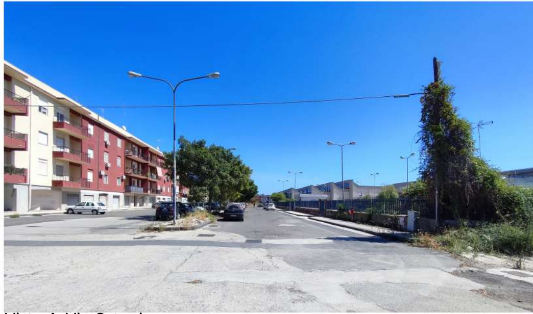
Vista 4. Via Catania