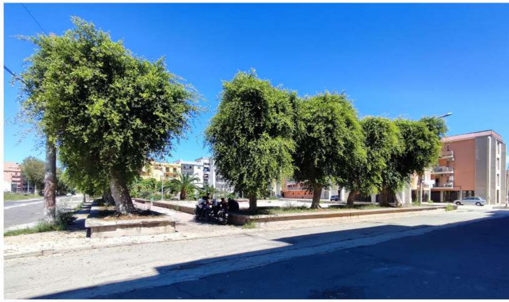
Vista 2. Piazza Mattarella