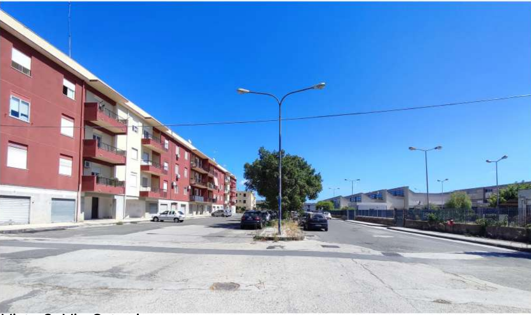
Vista 3. Via Catania