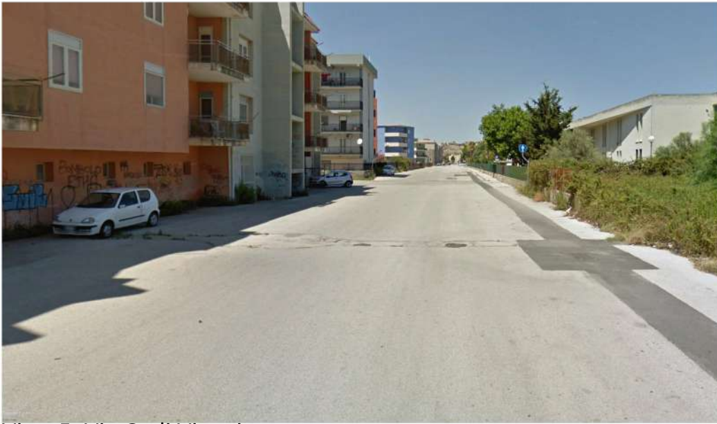
Vista 5. Via G. di Vittorio