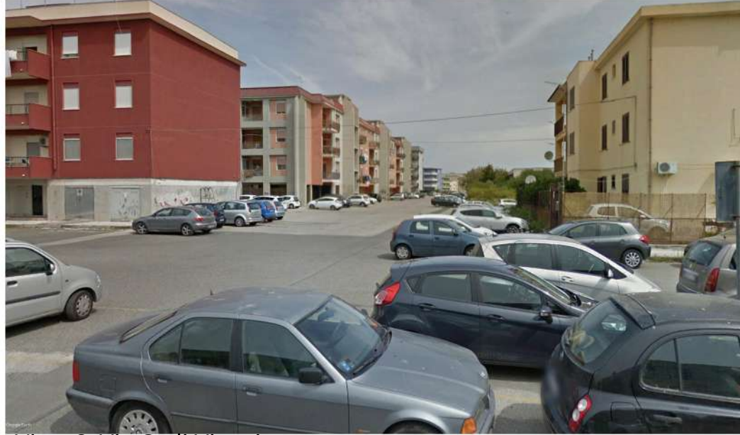
Vista 6. Via G. di Vittorio