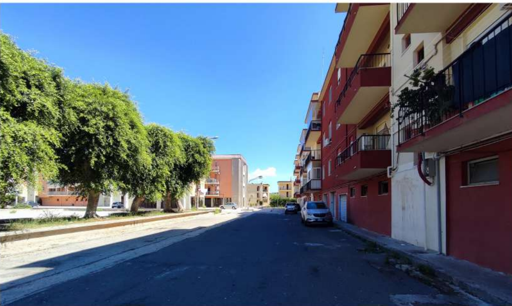
Vista 1. Piazza Mattarella