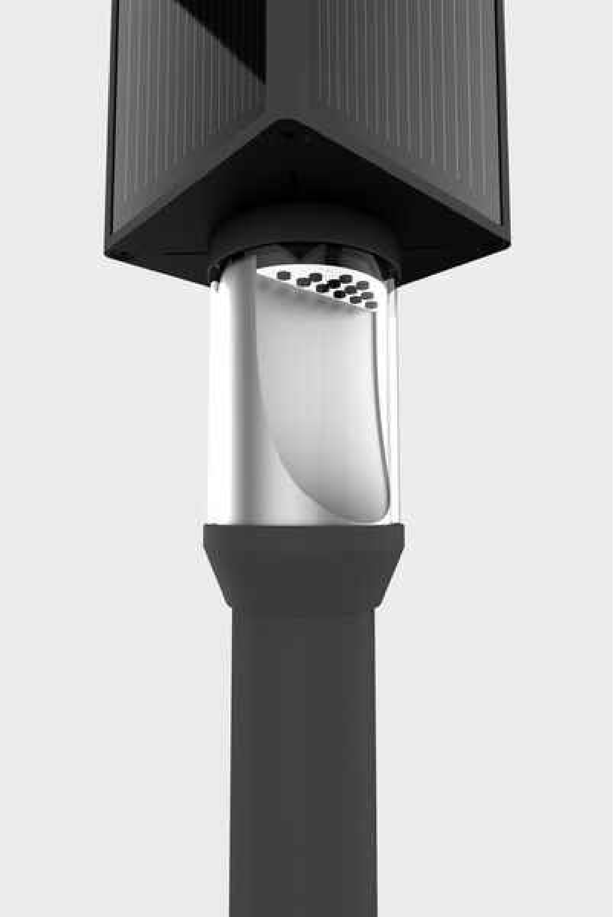
Tipologia di lampione ad alimentazione fotovoltaica