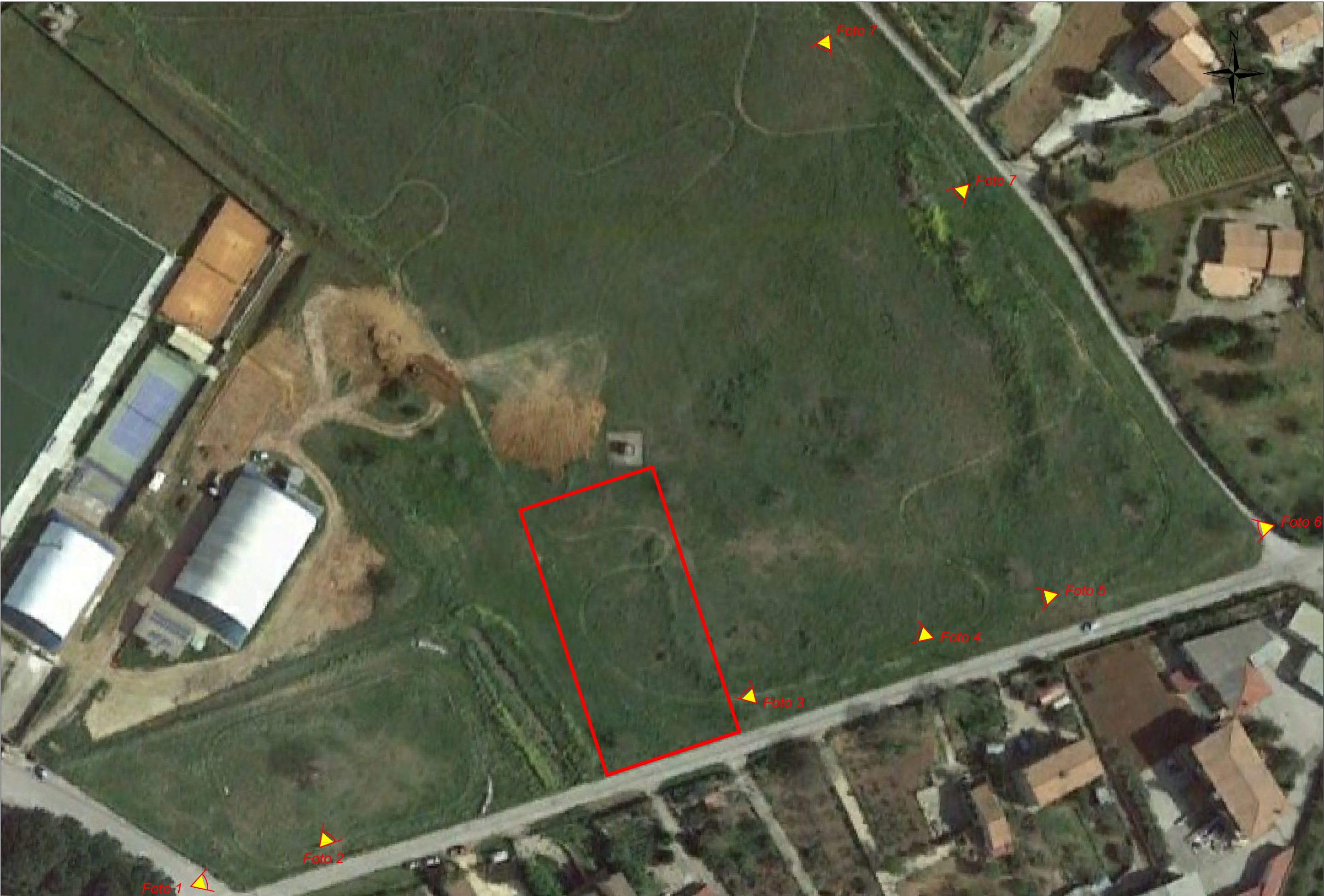
LOCALIZZAZIONE CCR SU ORTOFOTO (scala 1:1000)