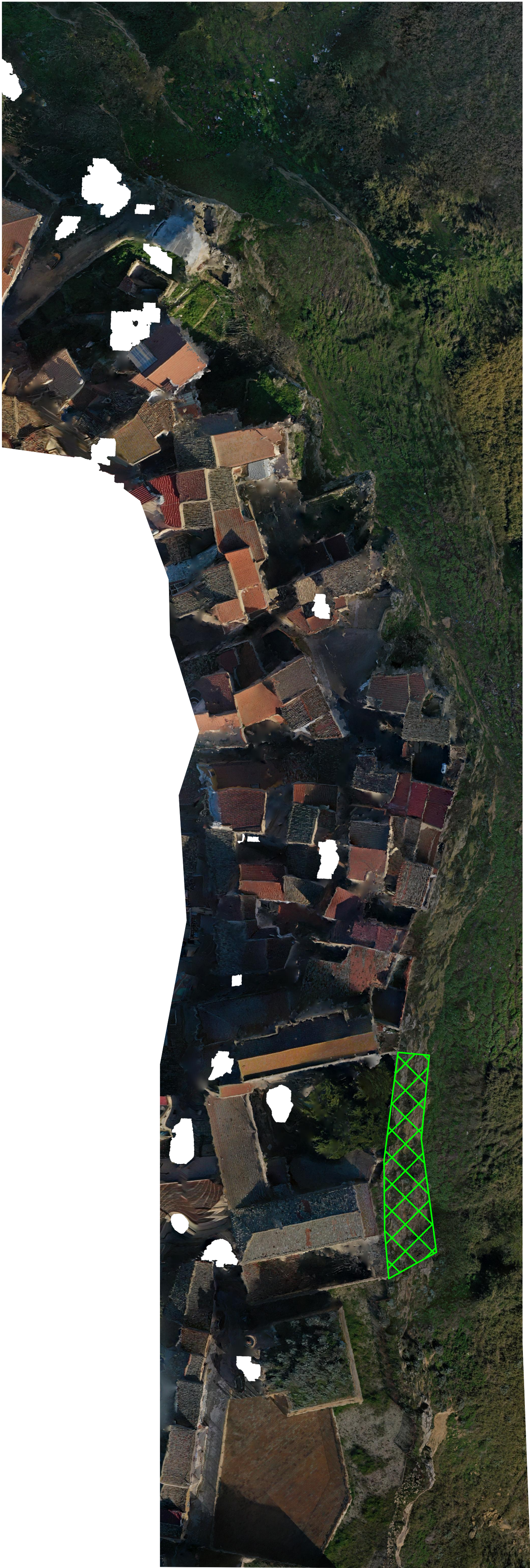
Planimetria ortografica intervento scala 1:500