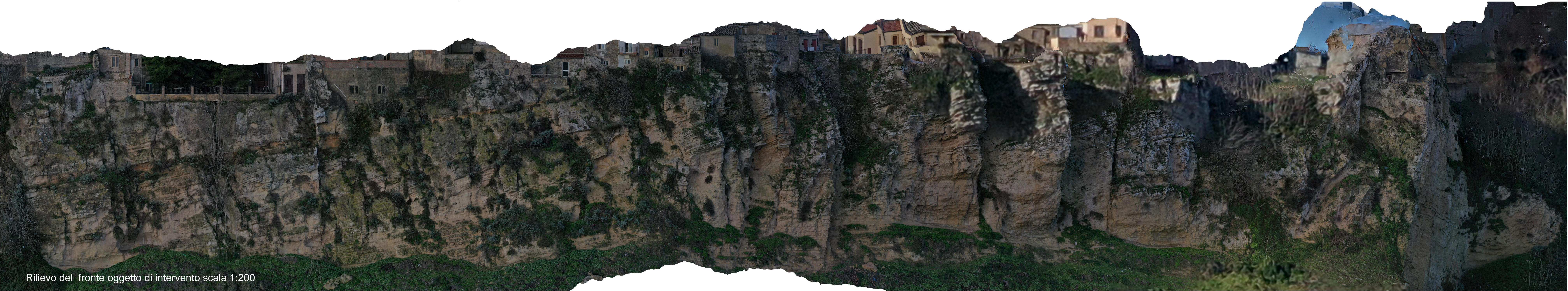
Rilievo del fronte oggetto di intervento scala 1:200