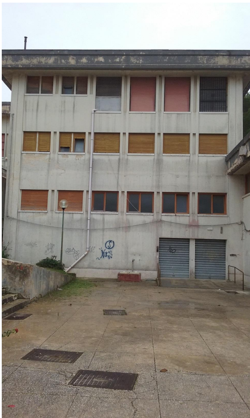
Prospetto Ingresso Principale Nord Ovest