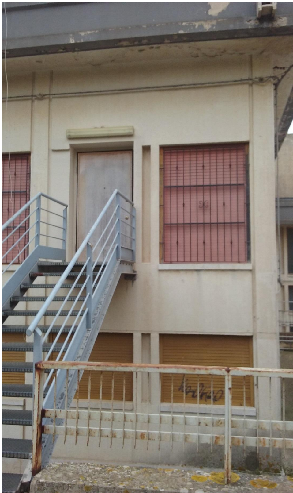
Prospetto Nord Est