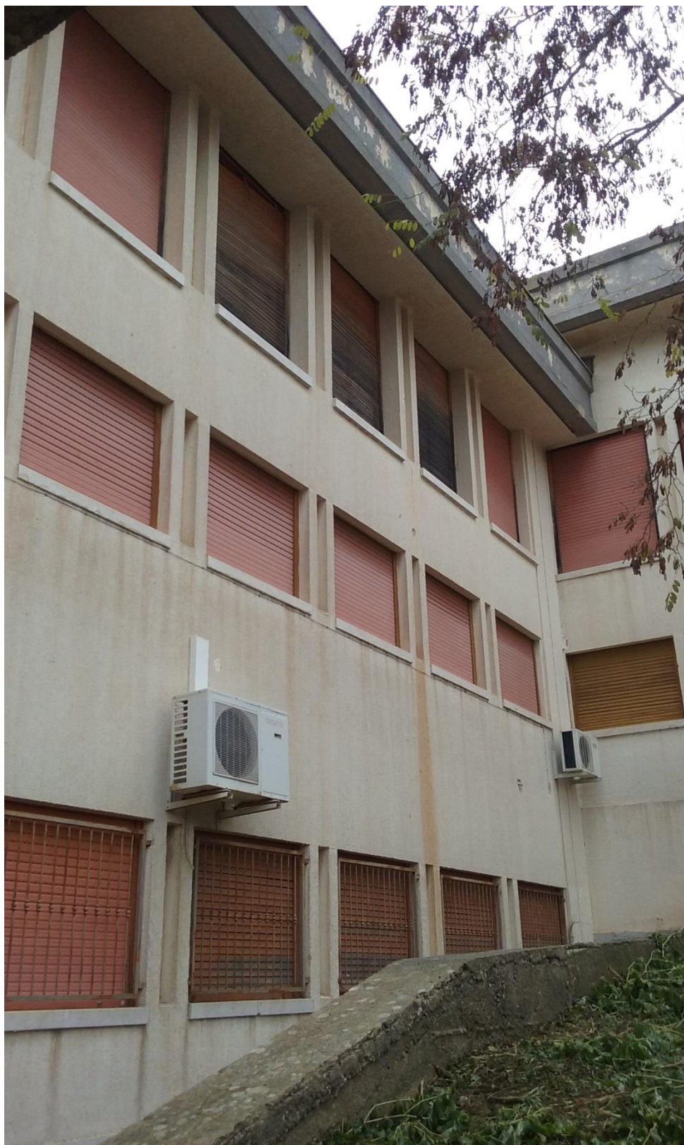
Prospetto Laterale Sud Ovest