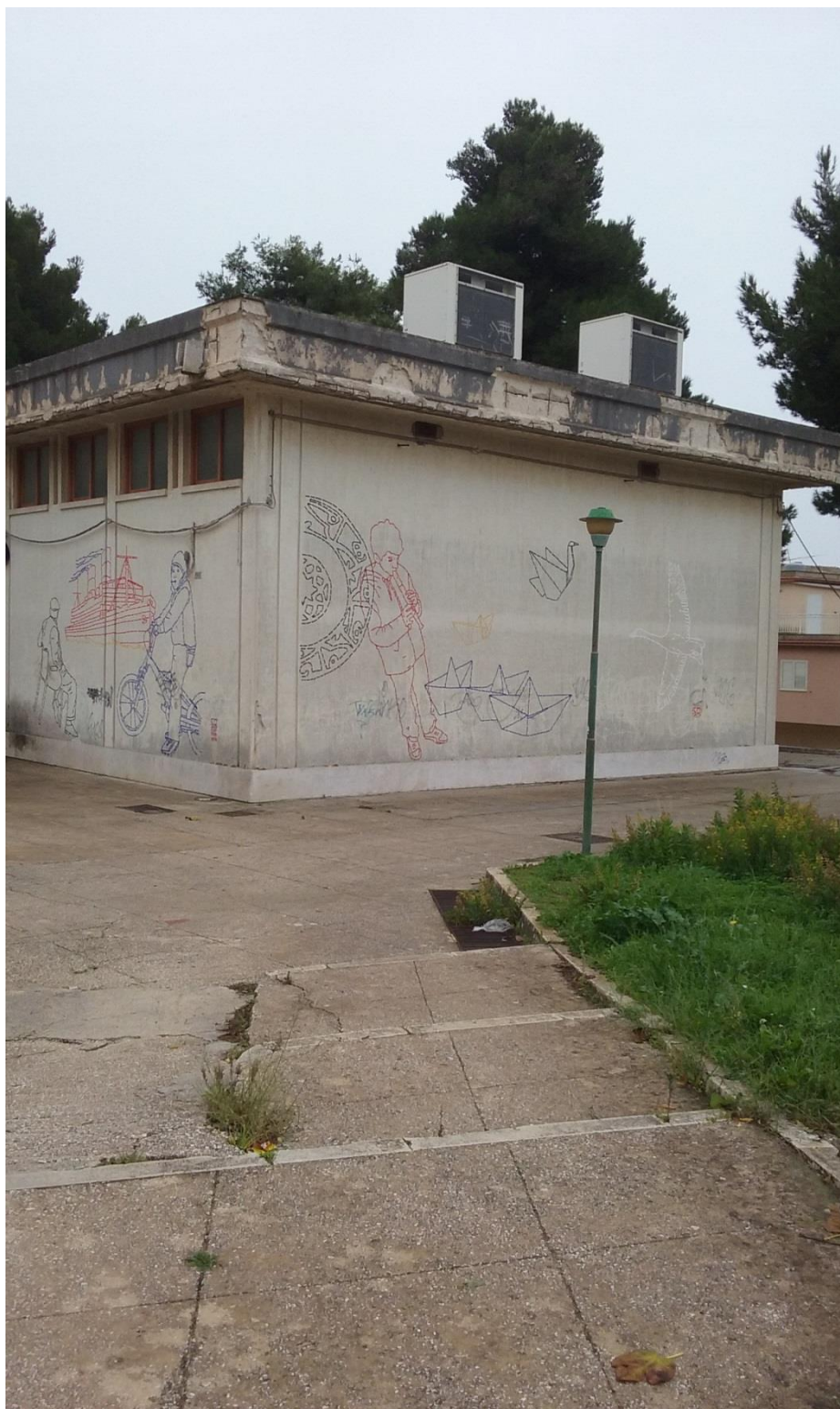
Prospetto Laterale Salone

Riqualificazione del Centro Sociale di Santa Ninfa, intervento mirato all' installazione di sistemi di produzione di energia da fonte rinnovabile, efficientamento energetico, riduzione di consumi di energia primaria e installazione di sistemi intelligenti di telecontrollo, regolazione, gestione, monitoraggio e ottimizzazione dei consumi energetici