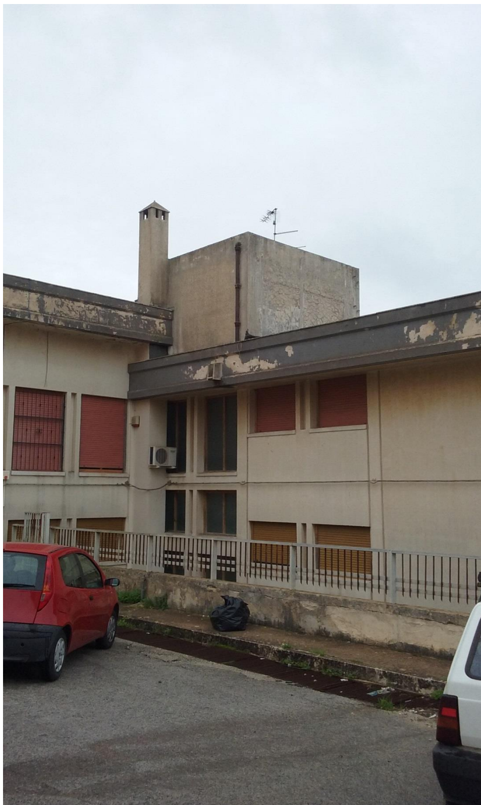
Prospetto Nord Est