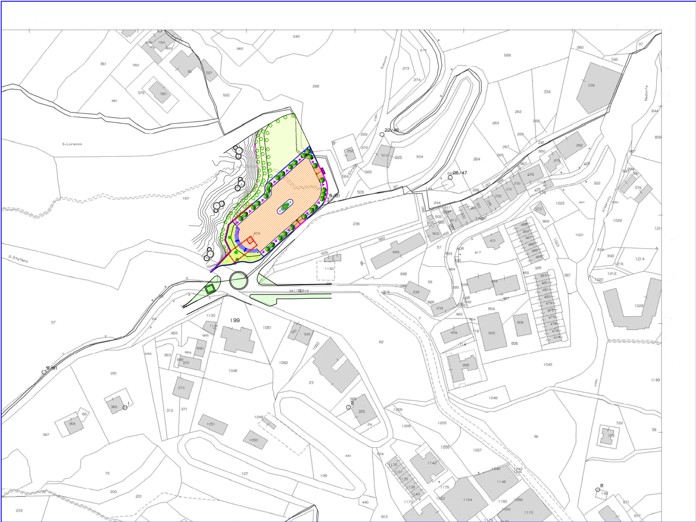
PLANIMETRIA CATASTALE CON SOVRAPPOSIZIONE DELL'INTERVENTO Fg. n. 80 SCALA 1:2000