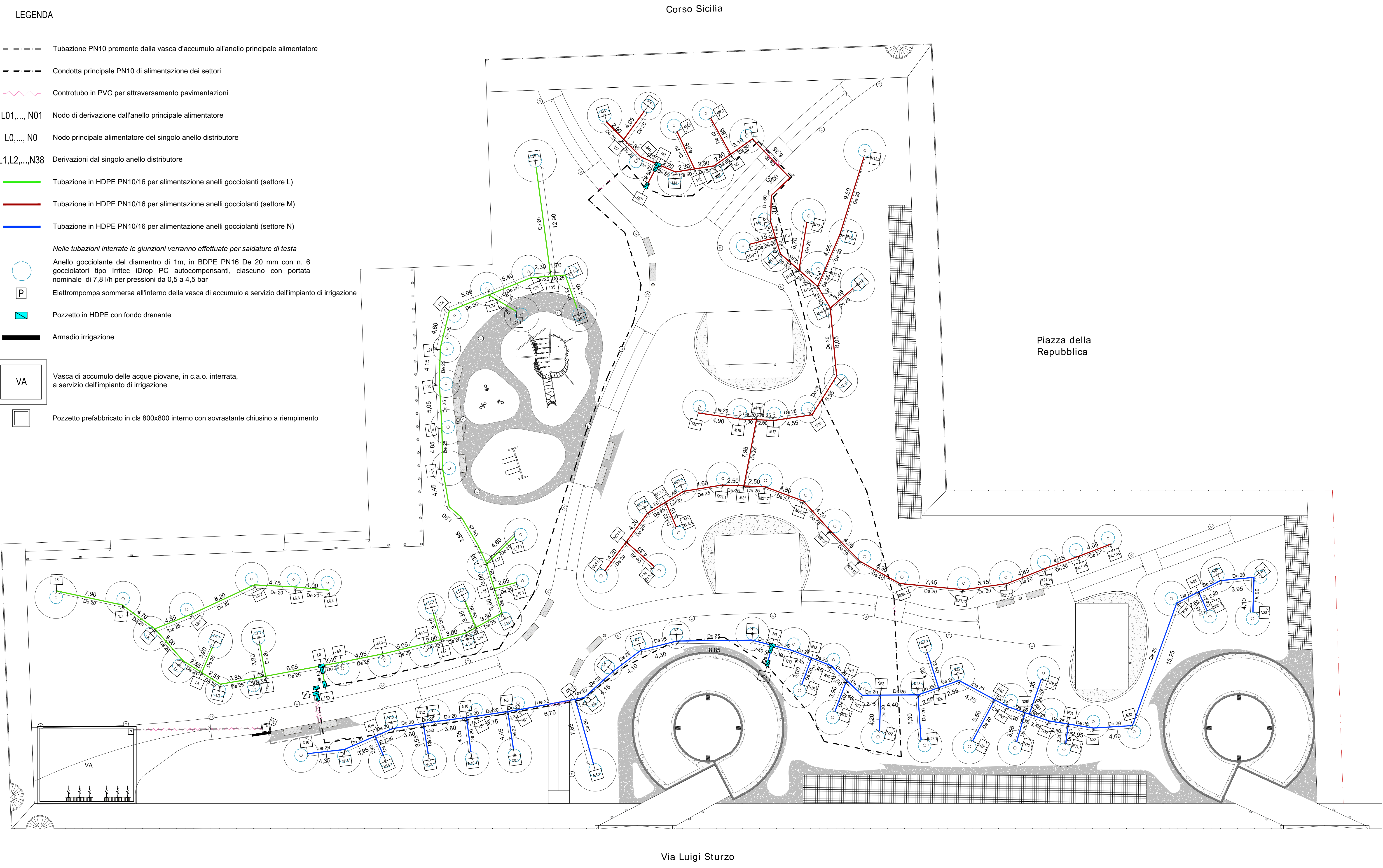
PLANIMETRIA scala 1:200