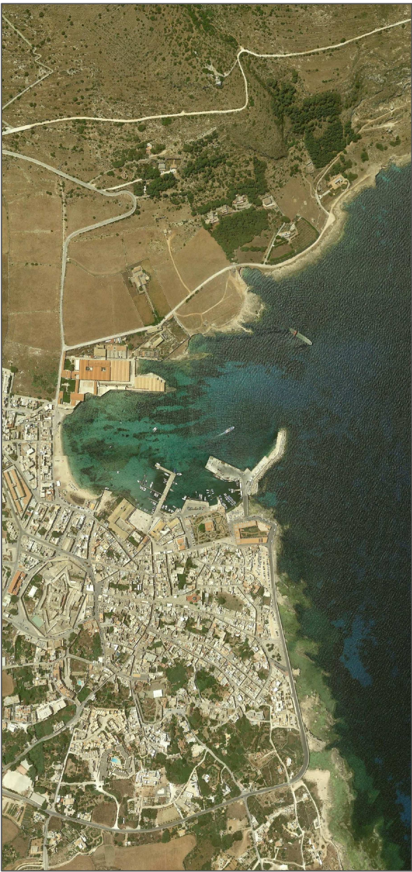
PROGETTO ESECUTIVO - 1° STRALCIO FUNZIONALE

Ufficio di progettazione: Ministero delle Infrastrutture e della Mobilità Sostenibili Provveditorato Interregionale Opere Pubbliche Sicilia - Calabria Ufficio 3 Tecnico e Opere Marittime per la Sicilia