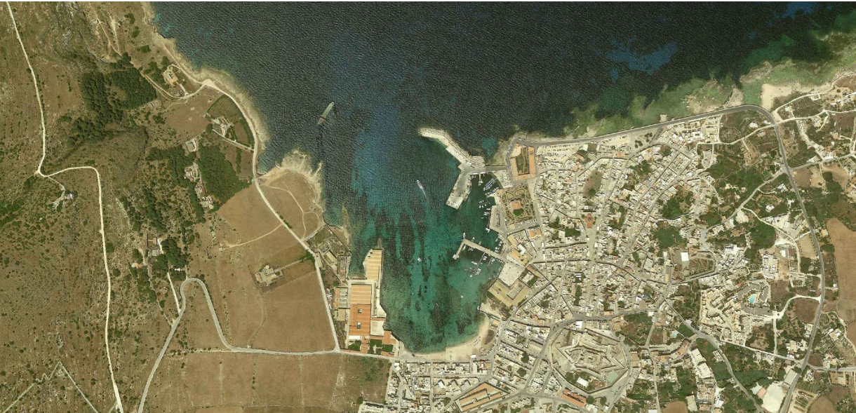
PROGETTO ESECUTIVO - 1° STRALCIO FUNZIONALE

Isole Egadi Comune di Favignana Provincia Regionale di Trapani